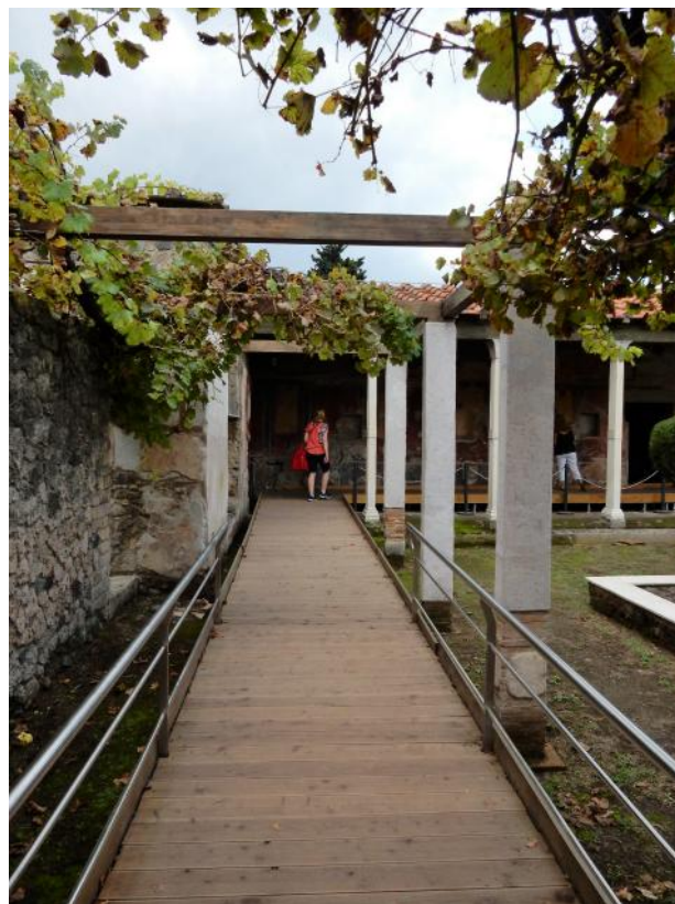
Foto 13-14 Il tratto di passerella che attraversa il Viridarium a sud e consente di raggiungere il Porticato con le colonne marmoree e gli affreschi parietali, è collegata all' hortus .