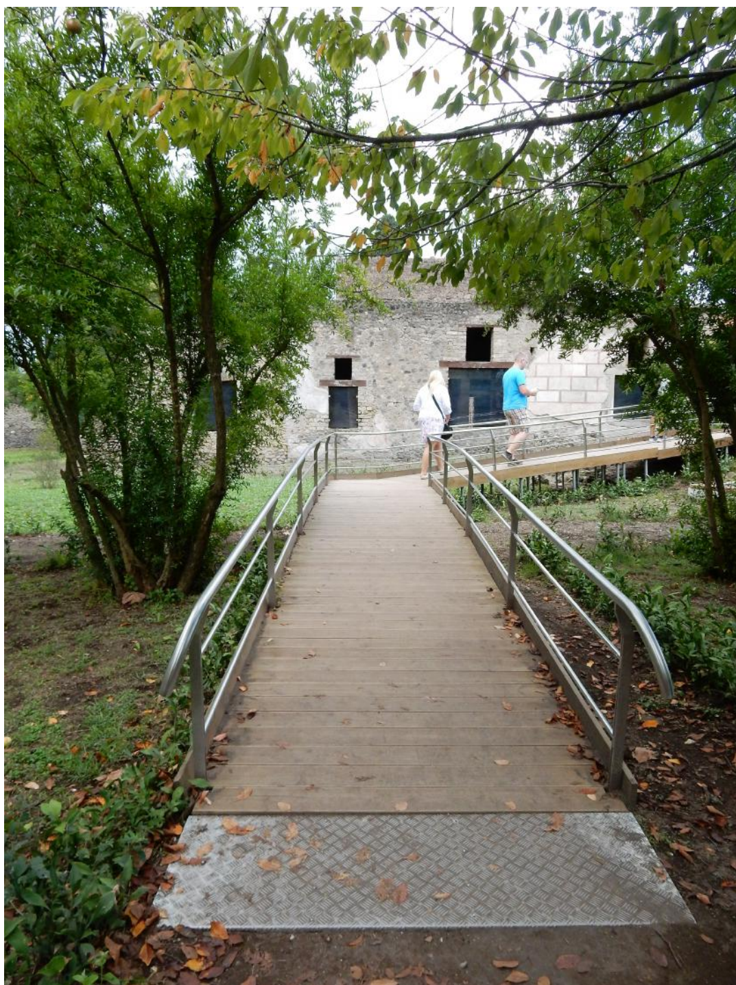
Foto 15 La passerella che dall' hortus conduce al Viridarium ha una pendenza dell'8% ed è dotata di ringhiera ad opportuna altezza (75 cm), atta al superamento delle barriere architettoniche per persone con ridotta capacità motoria oppure su carrozzella.