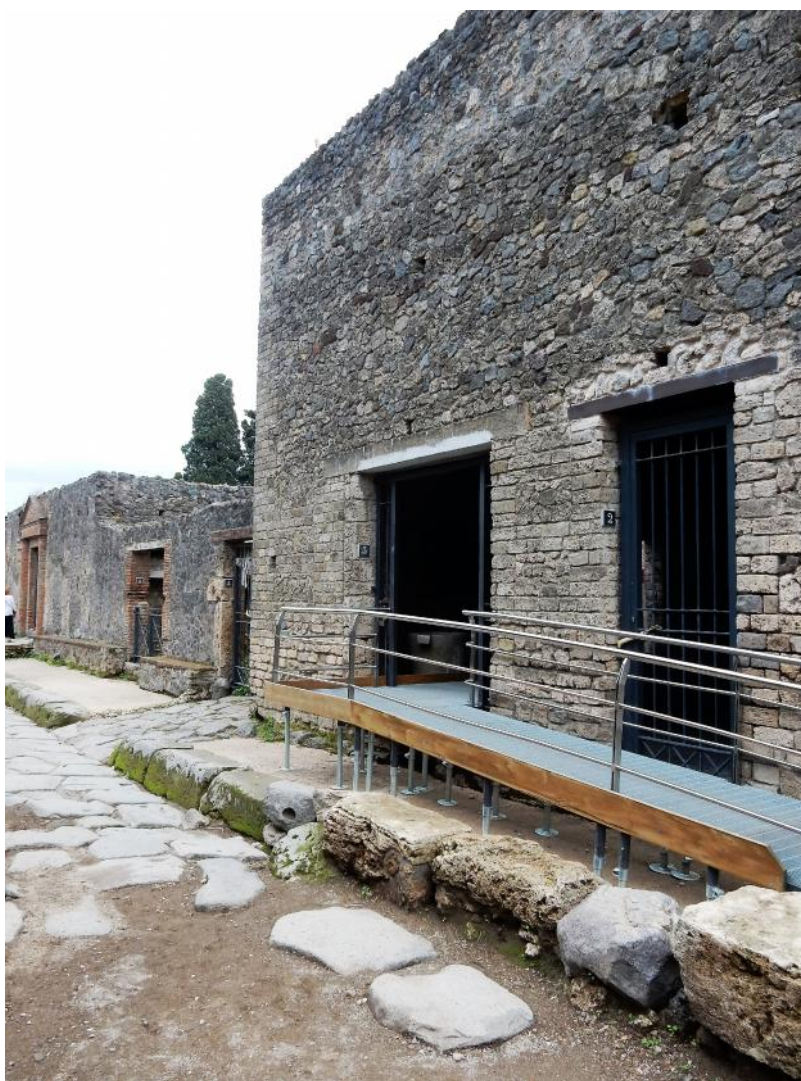
Foto 1 Ingresso attuale da via dell'Abbondanza con la rampa temporanea che verrà rimossa, a seguito dell'adeguamento dei livelli interni della passerella.