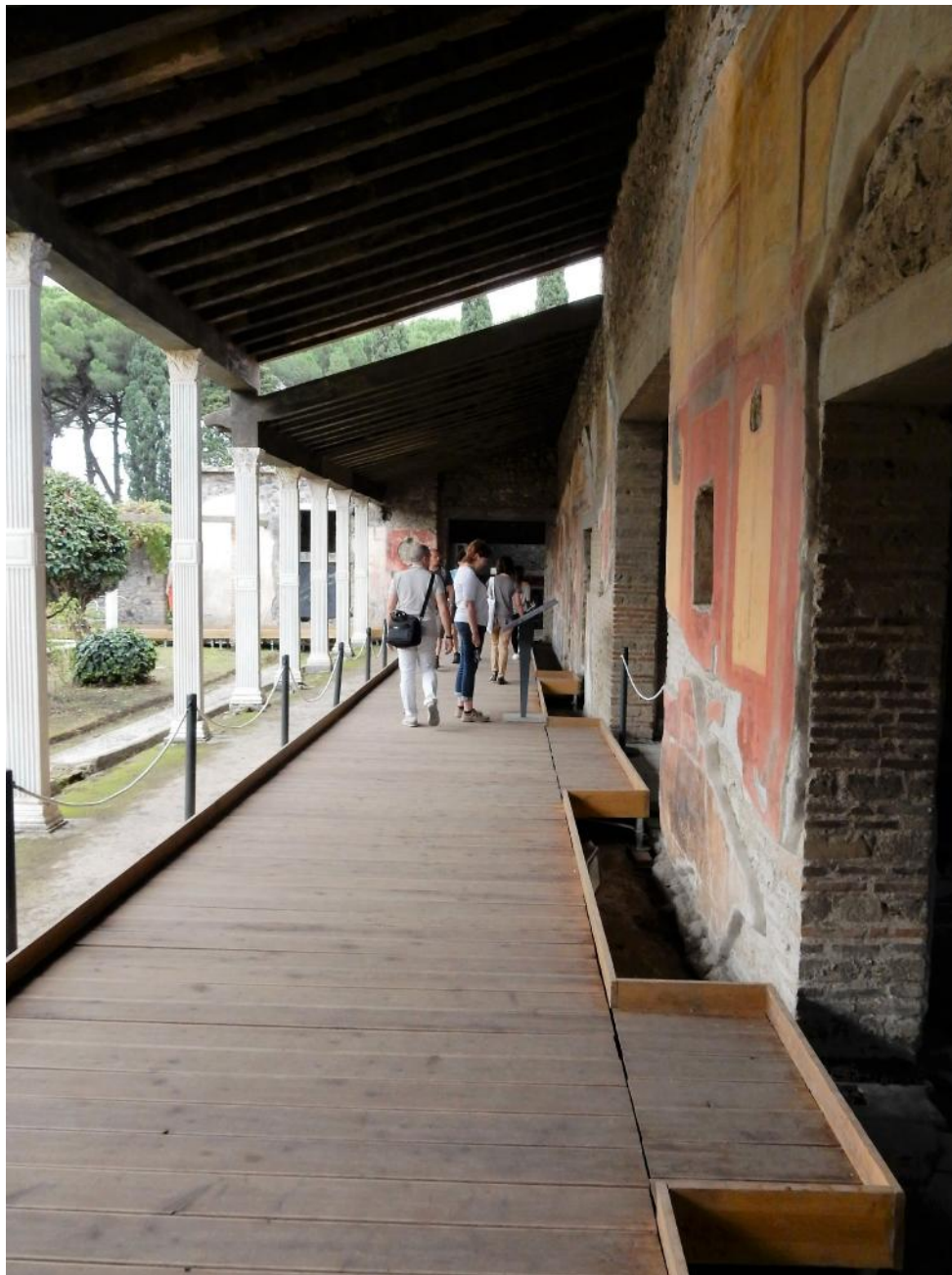
Foto 4 Il Porticato ambiente n.8 attraversato dalla passerella che consente di raggiungere sia gli ambienti dell'Impluvio sia il quartiere termale.