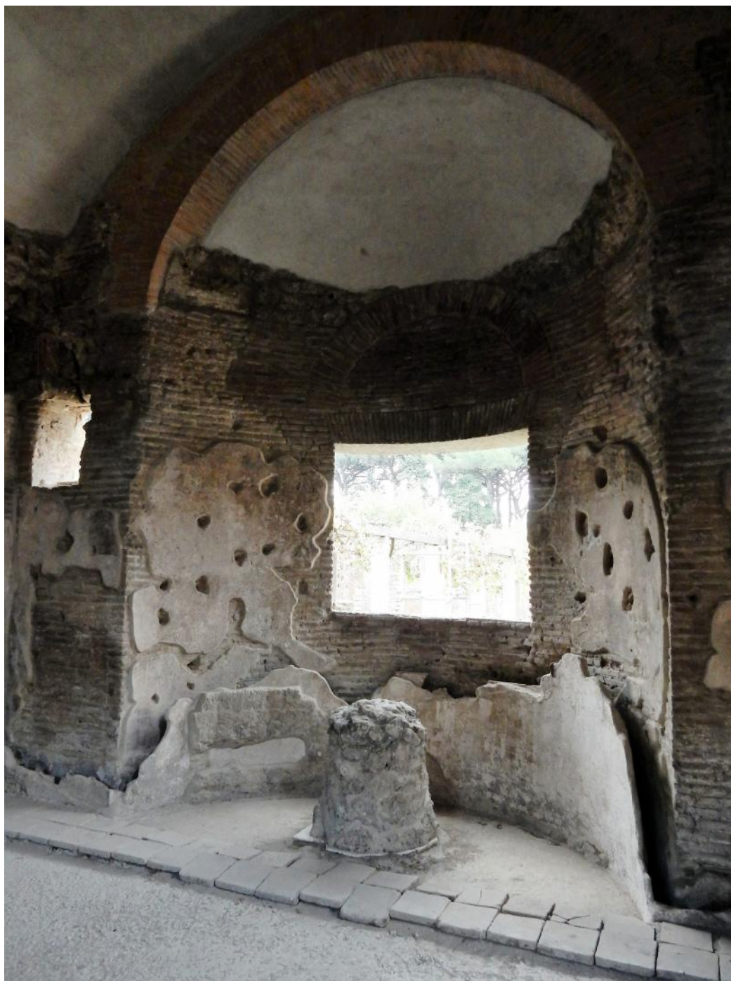
Foto 9 Il Calidarium sarà dotato di una piccola pedana in acciaio con pavimento in doghe di legno che, collegandosi alla passerella del Tepidarium , consentirà la visione dell'ambiente.