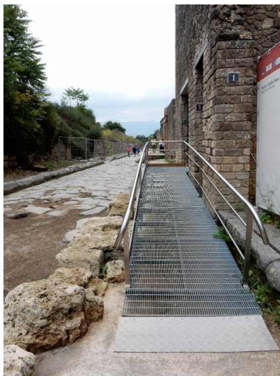
Foto 2 Vista della rampa su via dell'Abbondanza, con pendenza dell'8% e dotata di zoccolino fermaruote e ringhiera d'acciaio, atta al superamento delle barriere architettoniche per persone con ridotta capacità motoria oppure su carrozzella.