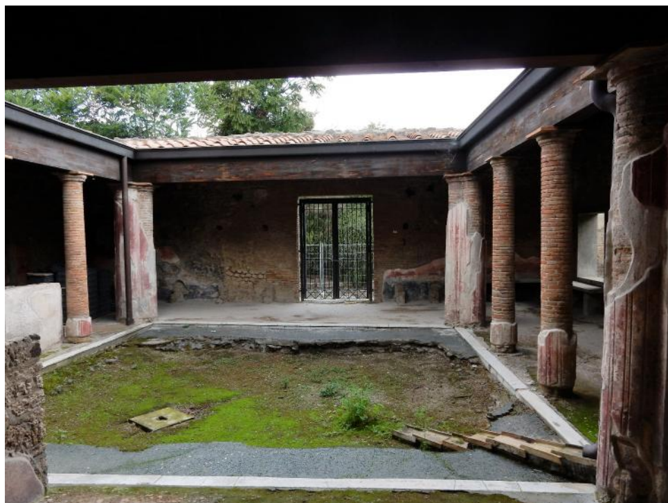
Foto 6-7 L'Atrio delle Terme visto dal Frigidarium e dall'ingresso su via dell'Abbondanza.