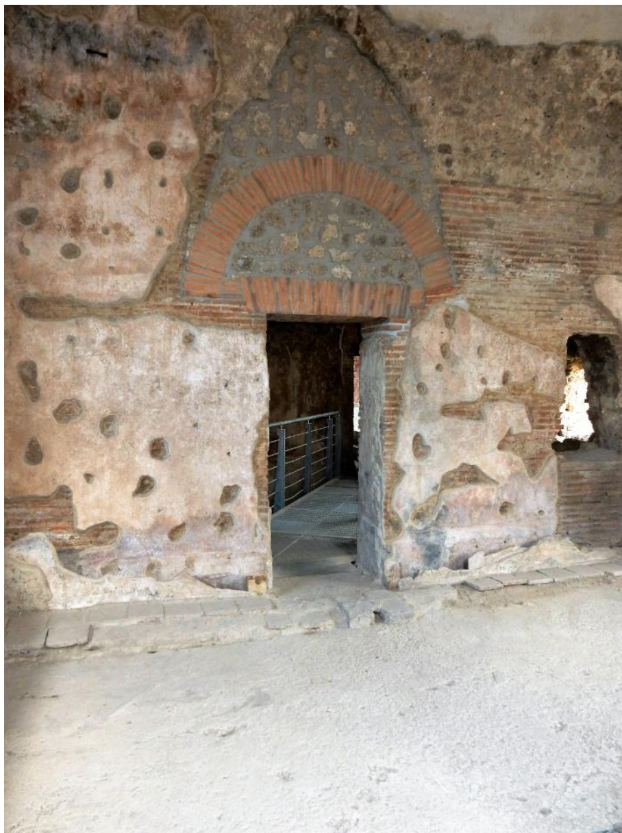
Foto 10 L'ambiente del Calidarium visto dalla parete ovest.