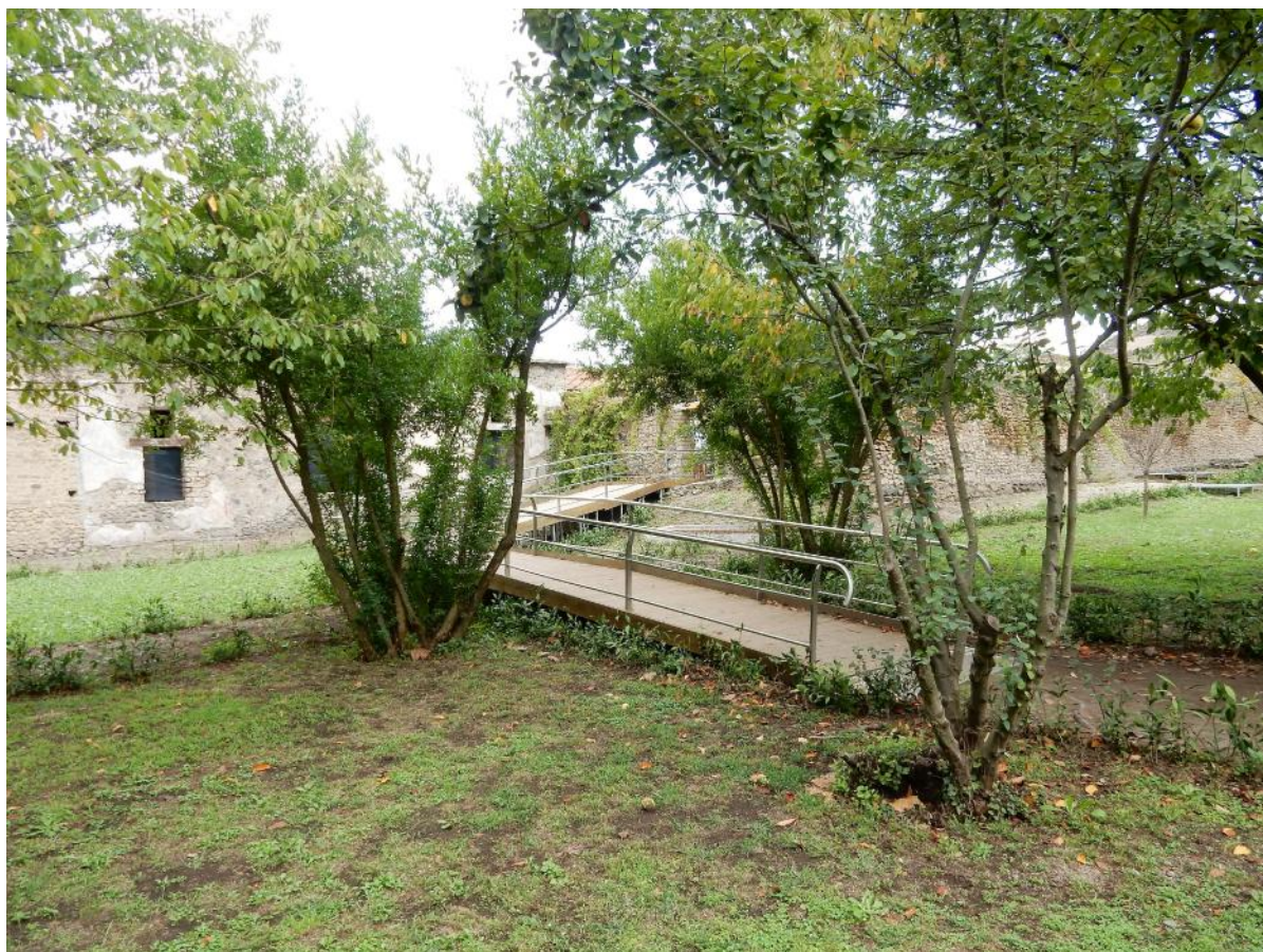
Foto 16 Per mitigare l'impatto della passerella nell' hortus nel tratto che conduce al Viridarium , dove la pendenza è tale da rendere il percorso lungo, è stata progettata una forma che si accompagnasse alle essenze arboree esistenti e sono state posizionate alcune nuove piante a bassa vegetazione lungo il bordo, per celare almeno in parte i piedi regolabili delle piastre portanti.