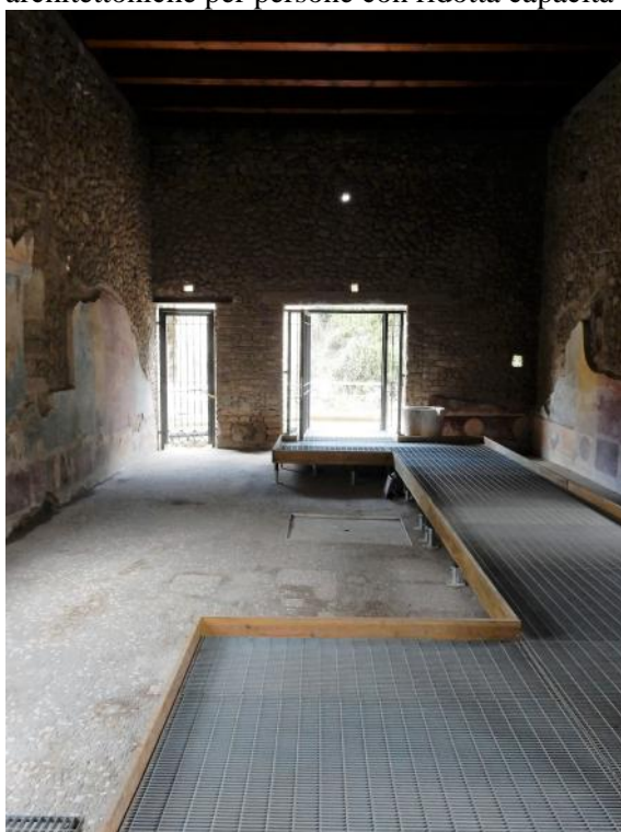
Foto 3 Atrio ambiente n. 24 con l'attuale passerella temporanea che conduce dall'ingresso su via dell'Abbondanza al Porticato ambiente n.8.