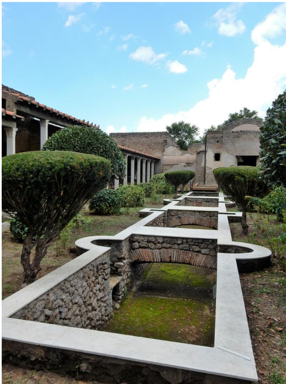
Foto 12 Il Viridarium visto dalla passerella posizionata a sud.