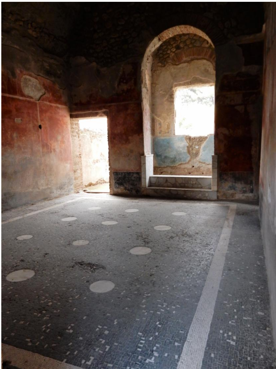
Foto 5 Nel Frigidarium ambiente n. 39 sarà posizionata una nuova passerella con grigliato in acciaio inox che consentirà la visione del pavimento in tessere di mosaico.