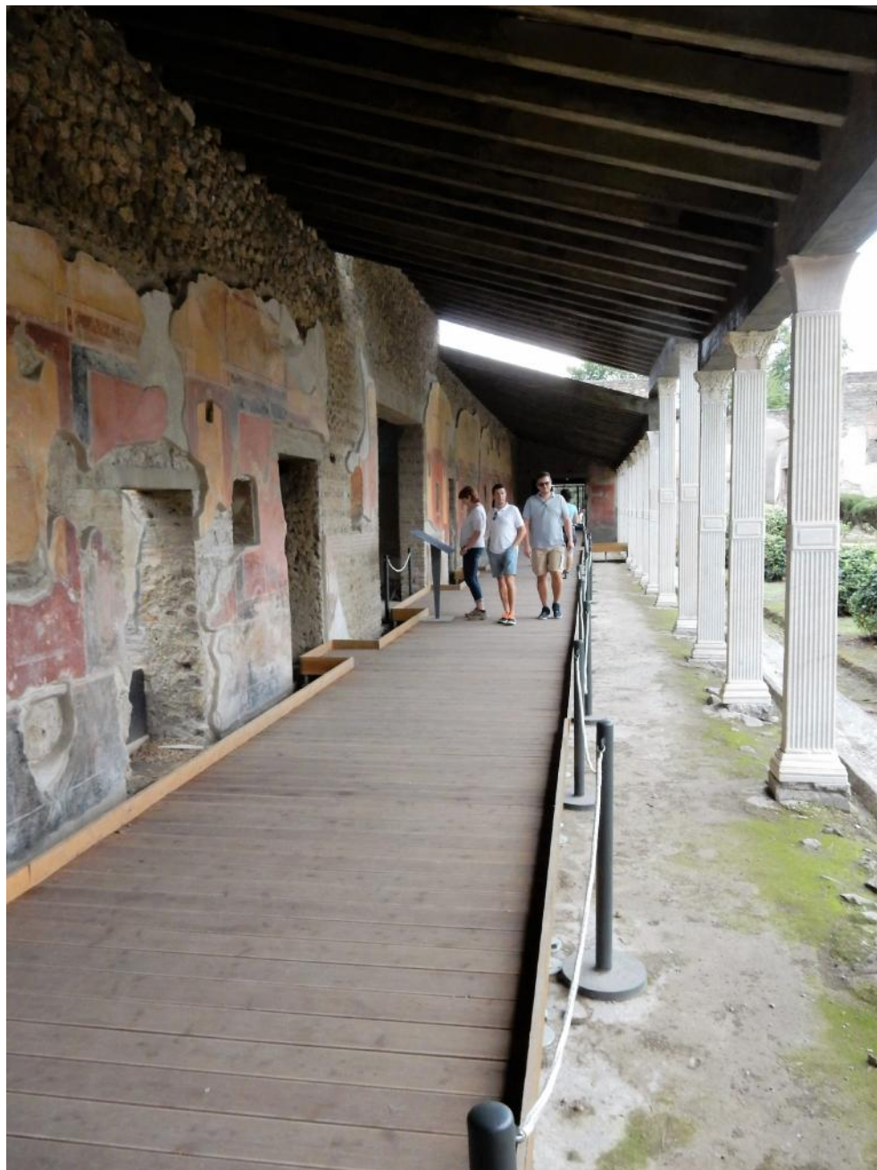
Foto 11 La passerella del Porticato verrà modificata con abbassamento della quota di calpestio, asportazione dei dissuasori e posizionamento di nuovi dissuasori d'acciaio composti da doppia piattina completi di cavetto e tenditore a scomparsa.